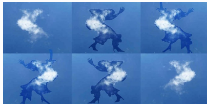
Polittico di una danza 3

Fotografa innovativa, concentra la sua attenzione artistica sul fenomeno della pareidolia delle nuvole, regalandoci immagini uniche e suggestive. L'abilità artistica e l'attenta osservazione fanno sì che la Ragazzi riesca a dar vita a forme ed oggetti semplicemente creando un contorno e/o giocando con luci ed ombre. Le sue fotografie ci trasmettono tutta la magia propria dell'arte: saper andare oltre la dimensione finita ed oggettiva per spaziare con la mente e il cuore in dimensioni infinite interpretabili secondo la soggettività di chi le osserva.