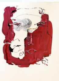
Smalti su cartone maschera

Nelle opere di Antonella Carraro il processo di creazione diventa un percorso catartico attraverso il quale l'artista entra in simbiosi con la tela. Non c'è consapevolezza del viaggio introspettivo che si è intrapreso, ma c'è un continuo avvicinarsi di cognizione ed emozione. La Carraro ha un rapporto quasi viscerale con il colore di cui utilizza solo quelli primari che mescola in un rituale meditativo fino a che è l'olio stesso a comunicare quando è pronto. È un rapporto simbiotico dove la cromia genera lo spazio lasciando traspirare luce, forma, segno, immagine.