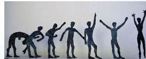
Dal gioco alla gioia

Quella di Vincenza Spiridione è una scultura figurativa di grande espressività, attenta al particolare e alla resa comunicativa di ogni dettaglio. I volti delle sue sculture si caricano di intensità umana, e quello che cattura e affascina l'osservatore è l'emozione e il sentimento che trapela da quei visi e da quelle mani. È una scultura ricercata che va oltre la resa espressiva, armonica, estetica e che porta l'artista a mettersi sempre in discussione arrivando a trattare tematiche sociali attuali e scottanti in un processo di necessaria riflessione costruttiva.